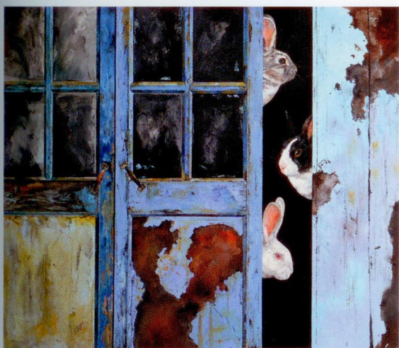
沈昊, 兔子门, 布面油画, 120x150cm, 2012